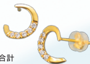
13 45cm ダイヤ 0.05ct