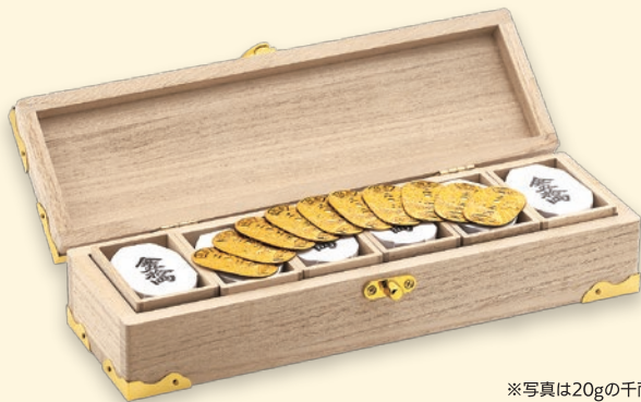
※写真は20gの千両箱です。