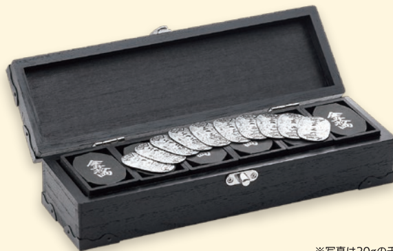
※写真は20gの千両箱です。