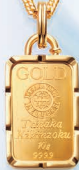
07 コインバー10g 枠の全周に溝切りを施し、 額縁のように 仕上げたコインバー。