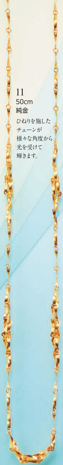
11 50cm 純金