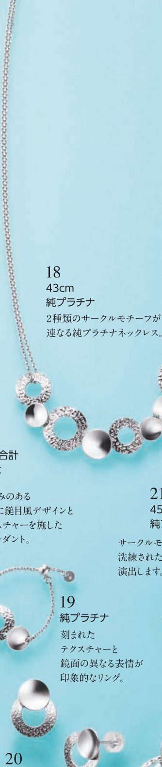
18 43cm 純プラチナ

16と17は、丸みのある 純金の表面に鈍目風デザインと ダイヤ、テクスチャーを施した 印象的なペンダント。