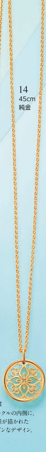
15 純金 サークルの内側に、 模様が描かれた モダンなデザイン。