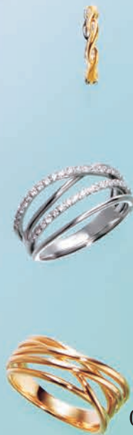
03 流線的なデザインの ゴールドとプラチナの ピアリング。