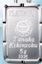
11 コインバー5g 枠のデザインは パドロック (南京錠)を イメージした コインバー。