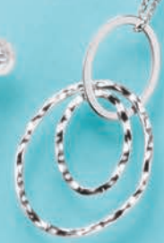
22 60cm 純プラチナ

チェーンの通し方で、 3通りのアレンジが 楽しめます。 ※写真のアレンジの場合、 トップ長さ約35mmです。