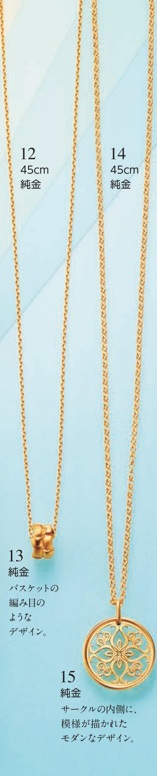
12 45cm 純金