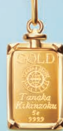
09 コインバー5g 枠のデザインは アンカー(錨)を モチーフとした コインバー。