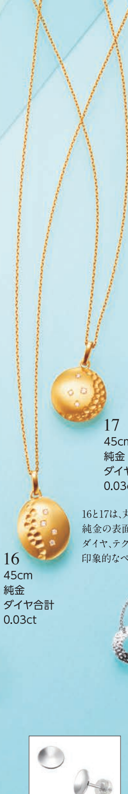
16 45cm 純金 ダイヤ合計 0.03ct

16と17は、丸みのある 純金の表面に鈍目風デザインと ダイヤ、テクスチャーを施した 印象的なペンダント。