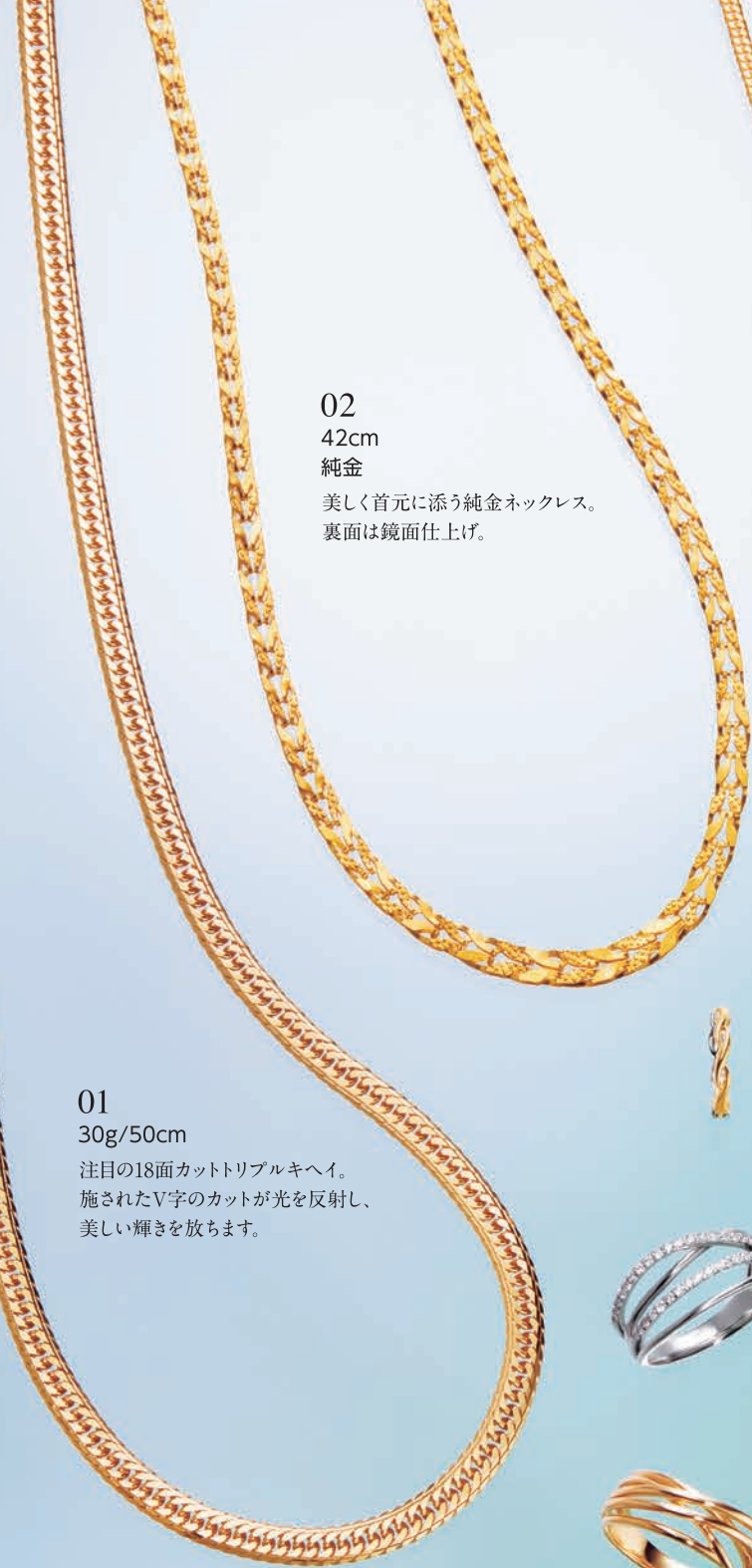
01 30g/50cm 注目の18面カットトリプルキヘイ。 施されたV字のカットが光を反射し、 美しい輝きを放ちます。