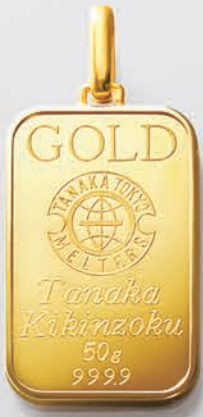
43 50g (リバーシブル)