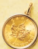
09 1/10オンス (リバーシブル)