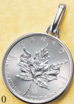
10 1オンス (リバーシブル)