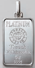
49 5g (リバーシブル)