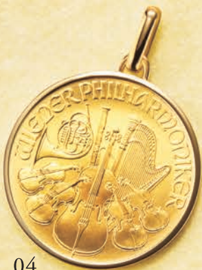
04 1オンス (リバーシブル)