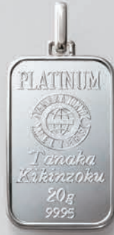
47 20g (リバーシブル)