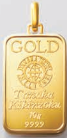
45 10g (リバーシブル)