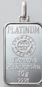
48 10g (リバーシブル)