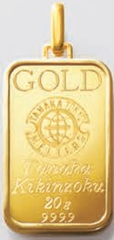
44 20g (リバーシブル)