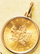
08 1/4オンス (リバーシブル)