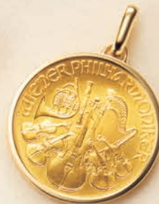
03 1/2オンス (リバーシブル)