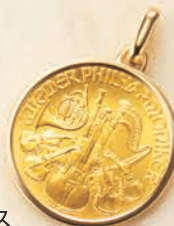
02 1/4オンス (リバーシブル)