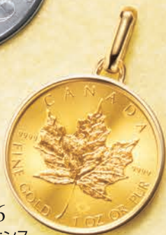
06 1オンス (リバーシブル)